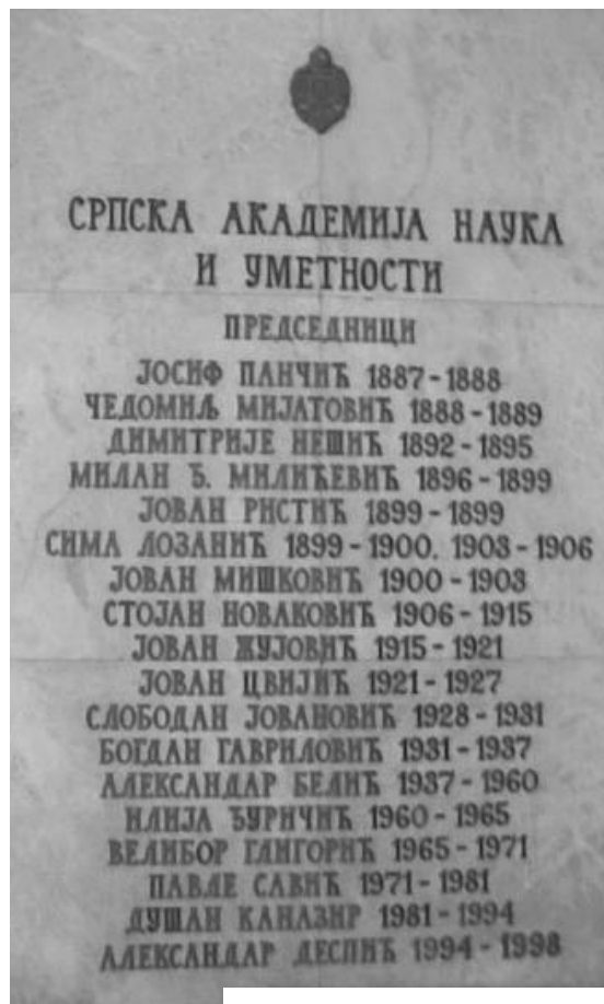
Srpska akademija nauka i umetnosti - ploča sa imenima predsednika Akademije