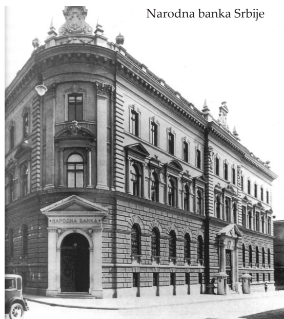
Narodna banka Srbije

korišćen u dalekoj i slavnoj istoriji srpske države, kao i da je despot Stefan Lazarević kovao nacionalni navac pod tim imenom 4 .